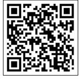
Imagem Google Maps POCINHOS