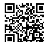
Imagem Google Maps SÃO SEBASTIÃO DOS FERREIROS